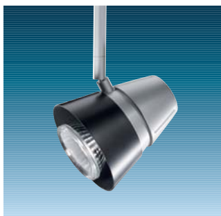
Graffiti S, PAR 20 silver