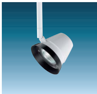
Graffiti S, PAR 16 hvid