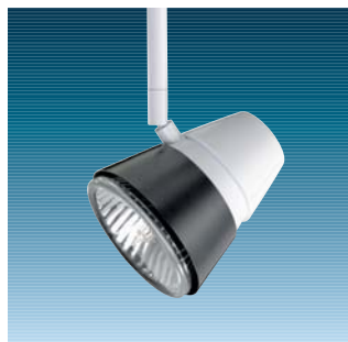
Graffiti S, PAR 30 hvid