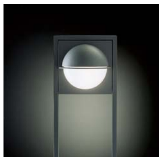
Equator på bøjlestander (BS1000)