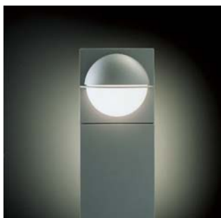
Equator med lukket stander (S1000)

Tilslutning: Tilsluttes 3x2,5 mm 2 klemrække i armatur. Mulighed for sløjfning i armatur. I den åbne stander kan kabel føres i profil til armatur.