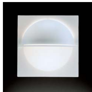
Equator i hvid (WHI)