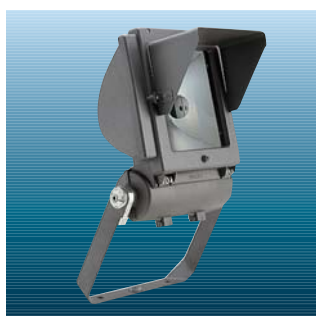
Visir (Se venligst katalogblad for Contrast C)