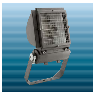
Beskyttelsesgitter (Se venligst katalogblad for Contrast C)