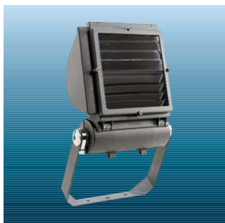
Justerbar lamelafskærmning (Se venligst katalogblad for Contrast C)