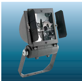
Barn doors (Se venligst katalogblad for Contrast C)