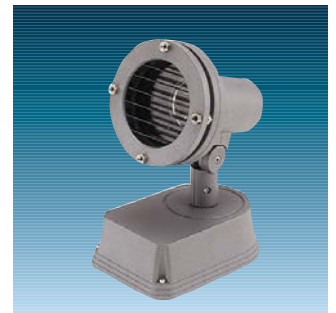
Contrast Pinspot med lamelafskærmning