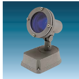
Contrast Pinspot med farvefilter, blå

Montering: Fodplade med el-udstyr monteres med tre skruer på den ønskede overflade eller på jordspyd, hvorefter armaturhuset med 3 stikken monteres og sikres med 3 unbracoskruer. Tilslutning: Contrast Pinspot er forsynet med en PG13,5 forskrning i bundpladen, hvorigennem spottet tilsluttes. Pinspot er forsynet med 3x1,5 mm 2 klemrække. Soklen er forsynet med udslagsblanket for synlig installation.