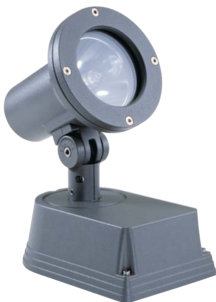
Contrast Mini Pinspot med rektangulær fod

Kompakt armatur velegnet til belysning af skulpturer eller til fremhævelse af specifikke arkitektoniske detaljer på bygninger