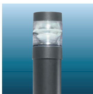
Chartor med fresnel linse