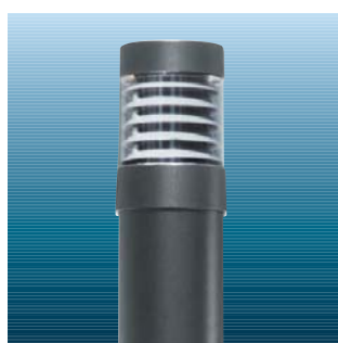
Chartor med lamelafskærmning