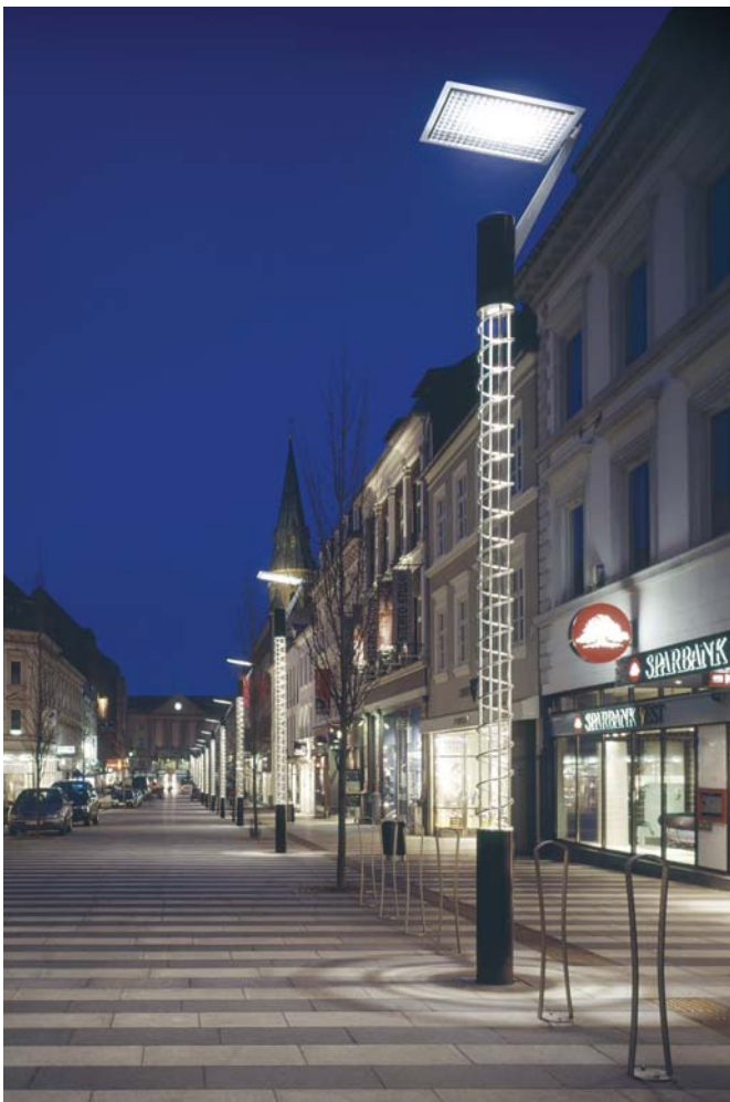
Specialversion til Århus gågade