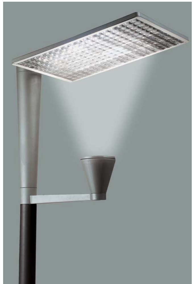
Aviso B med mosaik reflektor