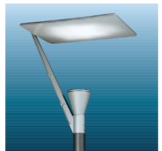
Aviso A med hvid reflektor

Aviso Mosaik bygger på et nyt, patenteret optiksystem. Hvert mosaikmodul består af ni enkelte mosaikker, der alle er støbt således, at der enten opnås en symmetrisk eller asymmetrisk tilbage-reflektering af lyset. hele mosaik topreflektoren består af 6x4 = 24 mosaikmoduler. Optiksystemet fungerer ved at lyset tilbage-reflekteres af metalliseringslaget. Metalliseringslaget er forseglet af et helt plant og transparent PMMA akryllag. På bagsiden har topreflektoren fået en beskyttelseslak, der er slidstærk og beskytter metalliseringen.